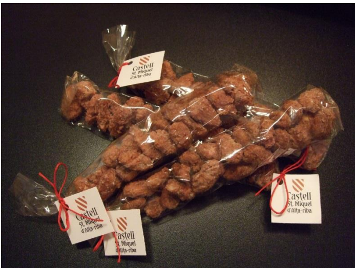
Ametlles del castell Sant Miquel d'Alta-riba

Durant la festa l'associació va comunicar als socis i assistents la magnífica notícia que recentment s'ha rebut la notificació de que AACCSMA ha estat declarada "Associació d'Utilitat Pública", i que a partir d'ara es podrà acollir al règim fiscal de la llei 49/2002 de règim fiscal de les entitats sense fins lucratiu i dels incentius fiscals al mecenatge (BOE de 24/12/2002). Un reconeixement a AACCSMA, per part del Departament de Justícia, a la tasca que duu a terme l'Associació respecte la dinamització socio-cultural del municipi i el territori; i a l'interès General de l'Entitat vers la recuperació del patrimoni històric de Catalunya, com és el Castell Sant Miquel d'Alta-riba.