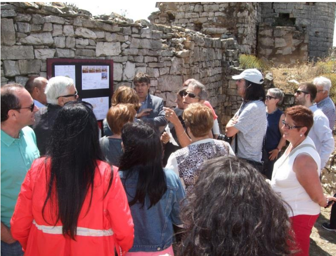
Presentació del Projecte de reconstrucció del Castell Sant Miquel d'Alta-riba.