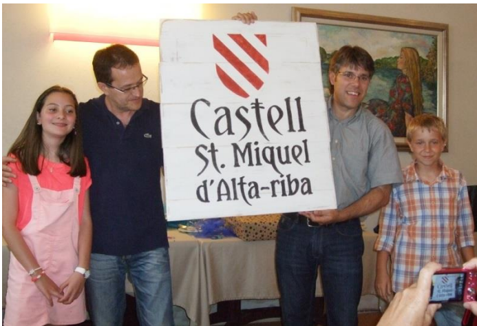
Regal dels Amics del Castell per les futures estances de la fortalesa.