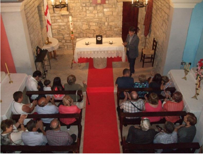
Visita a l'interior de l'Església de Sant Jordi d'Alta-riba per contemplar les millores i intervencions que AACCSMA ha dut a terme a l'Esglesiola.