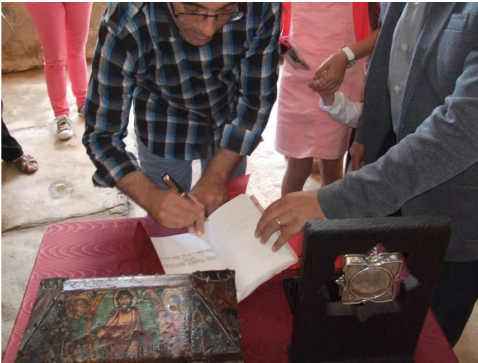
Signatura en el llibre de Drets i Honors del Castell Sant Miquel.