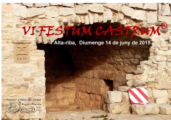
Postal - Cartell de la VI "Festum Castrum

Urbanisme, l'Ajuntament d'Estaràs i la Direcció General de Patrimoni de la Generalitat de Catalunya, però la negativa frontal, dels Serveis Territorials de Cultura a Lleida, a la recuperació de la casa forta, i al recreixement i encapçalament singular de la torre del castell