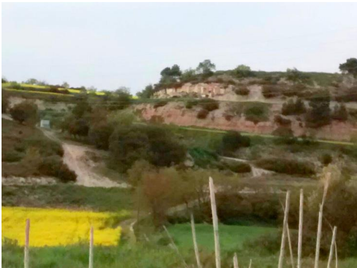
5 VISTA GENERAL DE LA ZONA AFECTADA DES DEL BASSAL D'ALTA-RIBA

L'escassa distància de 240 metres de distància entre l'explotació d'àrids i el nucli urbà d'Alta-riba, juntament amb l'extrema aridesa de la zona generarà a través dels vents predominats un augment considerable de partícules en suspensió afectant negativament en la salut respiratòria dels veïns; i no solament a Alta-riba sinó també els de Ferran, Santa Fe, Estaràs i Sant Ramon que són uns nuclis de població molt propers a la futura activitat extractiva. Cal destacar que en la zona els vents són constants i d'una elevada velocitat. Sol cal veure la proliferació de molins de vent que generen electricitat.