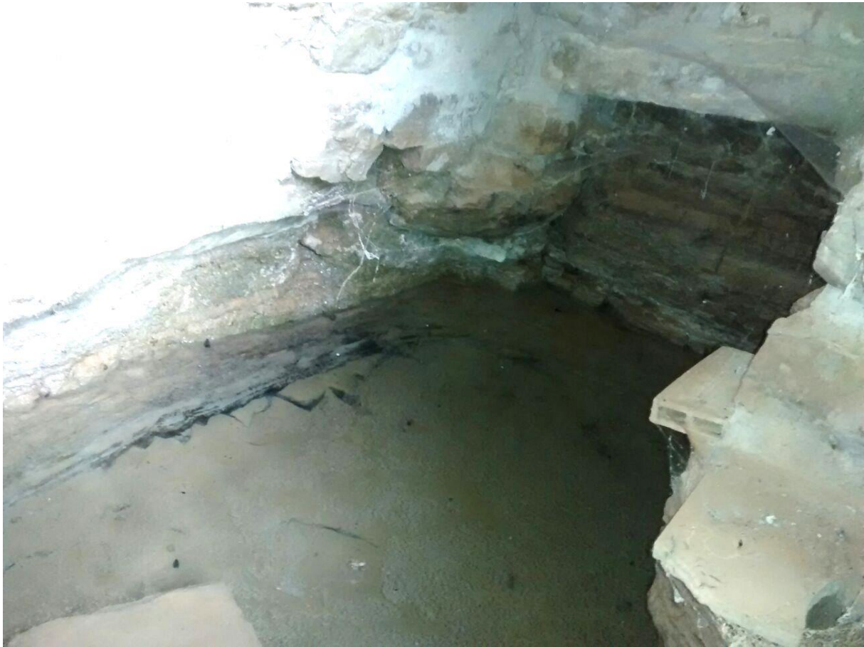
4 INTERIOR DE LA FONT D'ALTA-RIBA ON L'AIGUA BROLLA TOT L'ANY DEL TERRA

la zona afectada, i implica la desaparició d'alzineres i roures tal com es pot comprovar a través de la comparació d'imatges de varis anys i per contrast en parcel·les contigües a l'explotació (la 231 per exemple), on s'estan aniquilant i fent desaparèixer vegetació i arbres per guanyar cultiu.