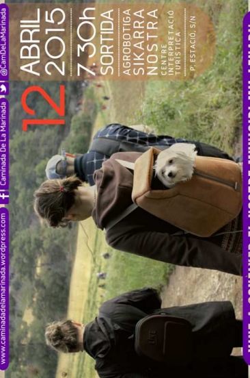
FOTOGRAFIA: XINCAELLA ●●● DISSENY: RAFAEL LITVINI I LAROSA

AGROBOTIGA SIKARRA NOSTRA CENTRE D'INTERPRETACIÓ TURÍSTICA P. ESTACIÓ, S/N