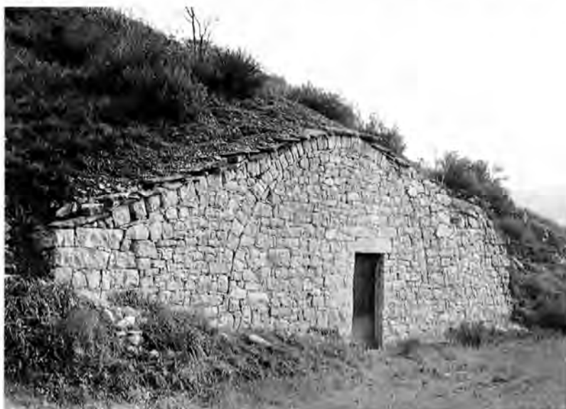
En marge de terra. El Talladell

va, finalment, la consistència adequada. Per efecte de la intempèrie aquest sostre s'anava recobrint d'herba o bé s'hi plantaven lliris que, pel que sembla —i a part d'una intenció meditada coqueta—, ho resisteixen tot i més en climes de secà. Feta la coberta es buidava tota la terra de l'interior de la volta i es construïen les parets anterior i posterior 8 . La porta podia quedar centrada, sota una llinda de pedra o de fusta on s'hi gravava, en casos l'any de construcció —o de reconstrucció—, i, rarament, algun altre petit indicatiu. Si l'arc quedava a la vista, la porta era usualment desplaçada del centre amb el possible objectiu de donar més estabilitat a la paret o, també, de separar-la del racó del foc (en qual-sevol cas el resultat és curiosament estètic). La façana podia quedar, com ja s'ha dit, formant part d'un marge o fent de mur de contenció. Havia, encara, la possibilitat de deixar la cabana sense façana, amb la qual cosa quedava una cova. La major part d'aquestes coves estan en els marges de pedra i s'utilitzen per tenir-hi estris, llenya i, fins i tot, com a garatge per a petita maquinària. També es poden trobar coves fora dels marges, inclosa alguna de grandioses dimensions —i amb una volta impecable—, feta, segurament per al ramat.