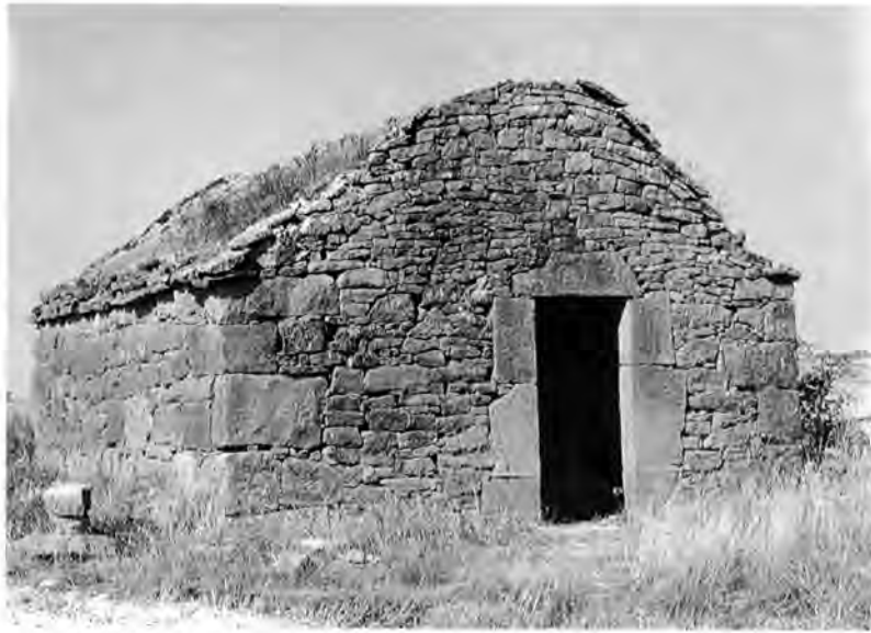
Arc parabòlic. Bellver de Sió.

n'hi ha per tota la banda sud de la ribera del Sió, amb perfils frontals oberts, i en pedra rogenca del mateix estil que la d'Agramunt, i que de vegades està també arrebossada. Entre aquestes cal destacar-ne una a prop de Moncortés, a la carretera d'Agramunt, que correspon a un cup de vi, encara visible 18 . Aquests dos tipus de cabana conflueixen a Guissona per la banda de Vellvehí i de la Morana, respectivament, en una zona de marges que va pujant des del gran arc que descriu la carretera de Ponts fins als plans de la Morana. De forma semblant al que passa a Cervera en l'espai de similars característiques, —encara que més discretes— n'hi ha també de diverses fesonomies. En una d'elles s'hi llegeix la data de 1909 escrita en xifres romanes. A l'altra banda del mateix arc de carretera, vora la casa blanca de «la font del pi» se'n veu una quadrada, de dimensions regulars i caire poc agraciats, quasi als peus d'una ermita que, pel seu aspecte —sostre de volta recobert d'herba—, es diria que també pertany a la família. Són, respectivament, «lo molinot» (clarament, un antic moli) i l'ermita de Sant Macari.