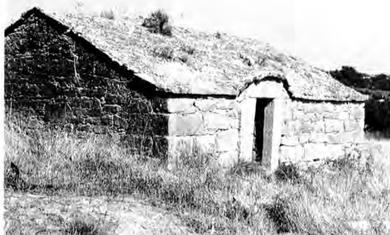
Façana lateral, Puigverd d'Agramunt.

rior. Estan en terreny pla i poc recolzades, de manera que és corrent veure les quatre parets. Són fetes en pedra arenosa roja, on el gris sauló no hi és estrany. En les d'una classe, la pedra queda mig amagada sota una capa de morter de calç amb terra que les revesteix d'un color rogenc esvaït. Es troben prop de la carretera, cap a Tàrrega, i cap a Montclar, i es van repetint per la part alta de la ribera del Sió 13 . Entre aquestes es troba, a peu de carretera, la de data més antiga: «ayn 1765» (sic). Unes altres tenen la clàssica forma de nau amb pedra vista, però amb la porta instal·lada en una paret lateral, cosa que les fa realment úniques. Estan a les dues bandes de la carretera esmentada, quasi totes dins del terme de Puigverd. La més localitzable —encara que és la més petita i informal—, es troba anant al pilà d'Almenara, al costat d'un gran lledoner i amb el sostre recobert de lliris 14 . La més remarcable, però, està vora l'antic camí ramader de Puigverd a La Guardia, passada la carretera, en un paisatge fortament erosionat, obert cap a la plana d'Urgell i d'un inexplicable regust prehistòric. Va ser feta per una família de pedrapiquers 15 de Puigverd amb grans carreus a tota la façana i un gruix de paret mínim