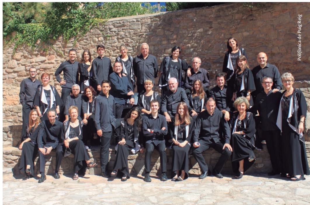
Polifònica de Puig Reig

Concert dedicat a La Nova Cançó amb arranjaments de Manel Camp escrits per a la Polifònica de Puig-reig. Completen el concert altres obres com El Bestiari de Pere Quart, de Manel Oltra, obres corals tradicionals catalanes i sardanes corals.