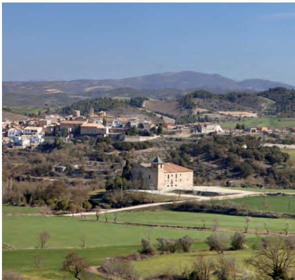
▲ Vista d'Ivorra des de la Costa de Vicfred, amb el Santuari de Santa Maria, proper i ahora separat del nucli més elevat de la població.