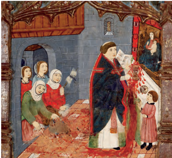
▲ Representació del miracle. Predel·la del retaule de Santa Maria i del Sant Dubte (inici del segle XVI), ara a l'església parroquial de Sant Cugat d'Ivorra.

Tal fet entronca en la temàtica general dels prodigis religiosos relacionats amb la naturalesa real del pa i el vi , consagrats durant la celebració de l'eucaristia. A la vegada, aconseguí mobilitzar per molts segles les principals instàncies religioses i temporals, generant un ric patrimoni de culte majoritàriament encara disponible i vital, així com també un flux constant de pelegrins durant els segles i fins avui.