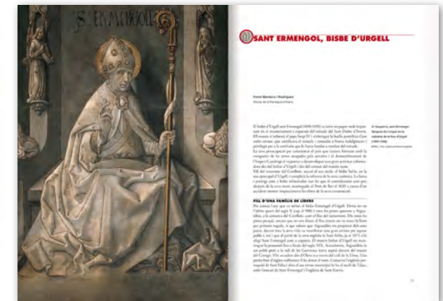
▲ Detall de les pàgines interiors del llibre/catàleg sobre els mil anys d'història del Sant Dubte d'Ivorra

Crèdits de l'exposició i presentació del llibre/catàleg sobre els mil anys d'història del Sant Dubte d'Ivorra.