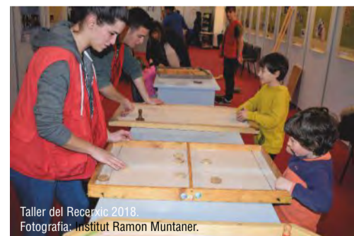
Taller del Recercat 2018.