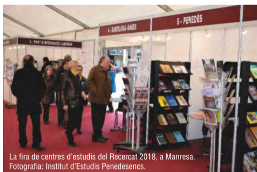
La fira de centres d'estudis del Recercat 2018, a Manresa.