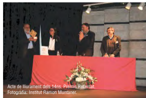
Acte de lliurament dels 14ns. Premis Recercat.