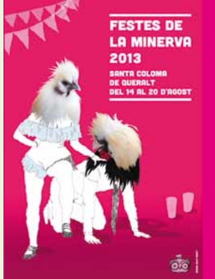
Disseny cartell: Míriam Rialp

A les 10 de la nit a l'entrada del Castell Concert d'estrena del Cor Vint-i-u juntament amb el grup Xiuxiueig del CORxeretes