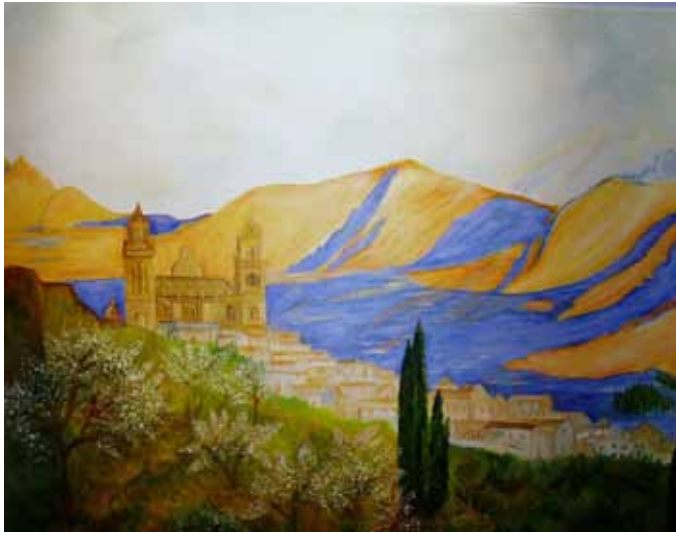
Interpretació del quadre de Josep Nogué Massó Vista de Jaén pintat per Rosa Cases Sendra.

Aquests quadres formaven part de l'exposició Els jubilats pinten Nogué Massó feta a la sala gòtica del castell des del 18 de maig al 2 de juny passat.