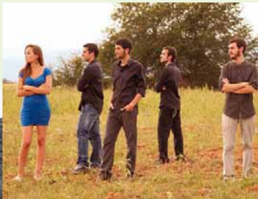
Verd i Blau